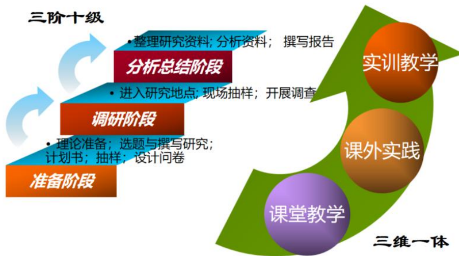
图 2：“三维一体”和“三阶十级”的教学模式